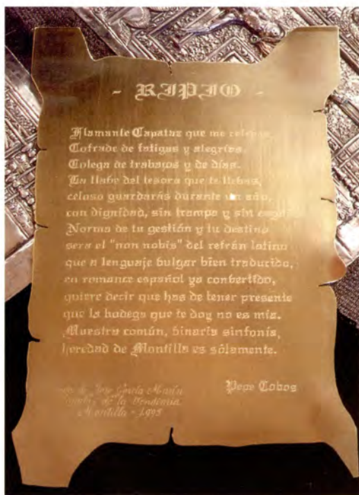
Ref.- DC 0000 Grabado a mano sobre Metal, Cobre, Plata y Oro (Presupuesto)