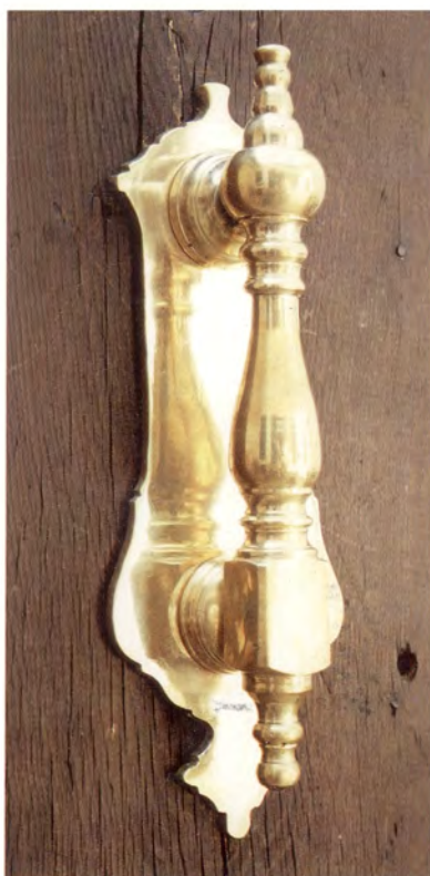
Ref.- DA 9000 Aldabón Placa Grande Medidas 28 x 10 cm. 2150 grs.