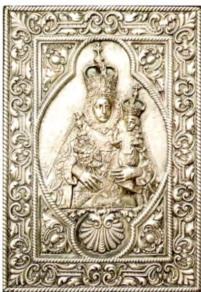
Ref.- DC 2000(*) Cuadro Virgen de Araceli Medidas 40 x 28 cm., 350 grs.

Todos nuestros fabricados están protegidos por la Ley de Patentes y Marcas bajo la denominación de ANGULO , numerado para control de modelos y garantía del comprador.