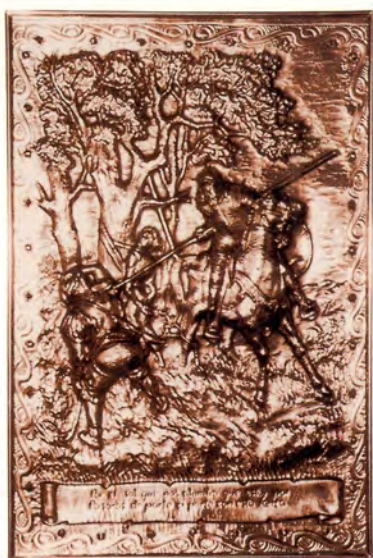
Ref.- DC 10700 (6)