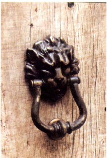
Ref.- DA 5080 León Chico Medidas 17 x 9 cm. 900 grs.