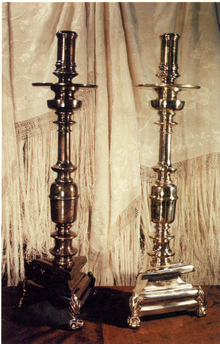
Ref.- DI 3000 Candelero Siglo XVII Medidas 55 x 18 cm. 3950 grs.

ACABADOS: -Metal Patinado. -Bronce Viejo. -Plateado Oxidado.