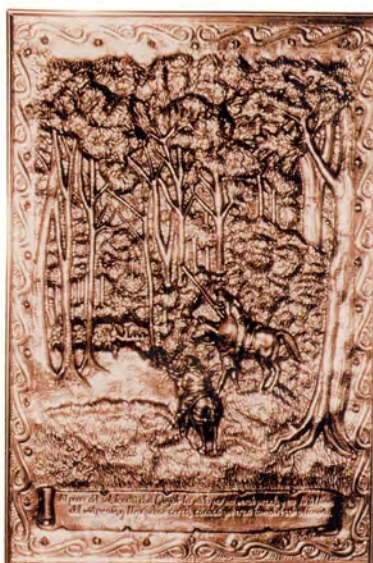
Ref.- DC 10700 (8)

ACABADOS: -Cobre Patinado. -Plateado Oxidado.