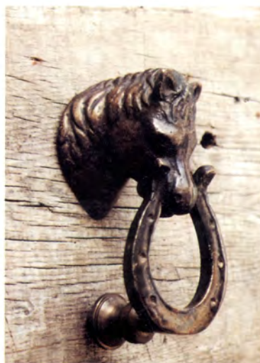
Ref.- DA 6080 Aldabón Caballo Medidas 10 x 9 cm. 1050 grs.