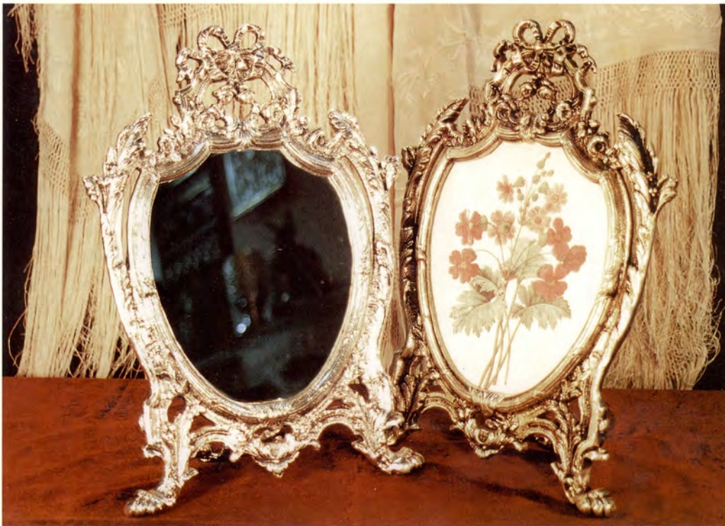
Ref.- DE 4000 Espejo Lazo Porta Retrato Medidas 40 x 26 cm. 2250 grs.