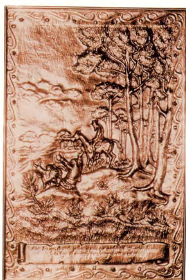
Ref.- DC 10700 (9)