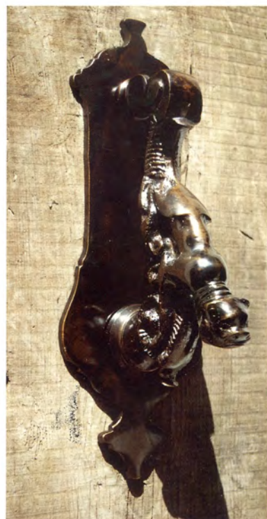
Ref.- DA 8080 Aldabón Perro Medidas 29 x 9 cm. 1150 grs.