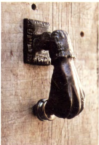
Ref.- DA 3080 Aldabón Mano Chica Medidas 16 x 5 cm. 1200 grs.