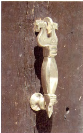
Ref.- DA 1000 Aldabón Forja Chico Medidas 19 x 5 cm. 500 grs.