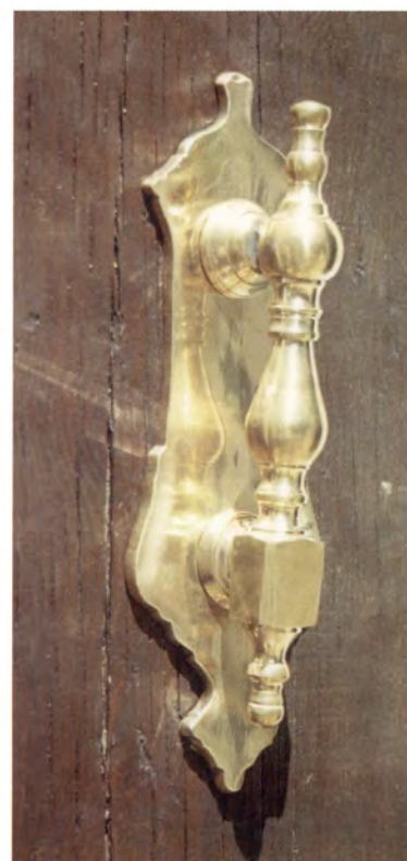
Ref.- DA 10000 Aldabón Placa Chica Medidas 23 x 8 cm. 900 grs.