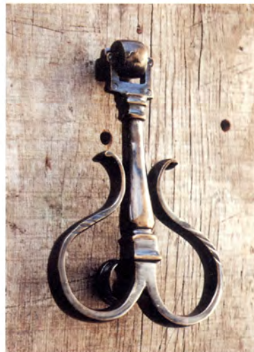
Ref.- DA 4080 Aldabón Lazo Medidas 21 x 13 cm. 800 grs.