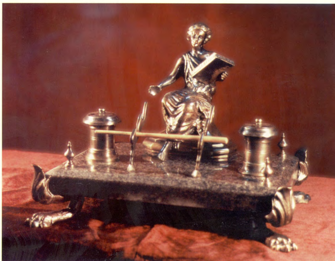
Ref.- DB 2000 Escritoría Dama, Lira/Libro Medidas 34 x 25 x 25 cm. 5600 grs.