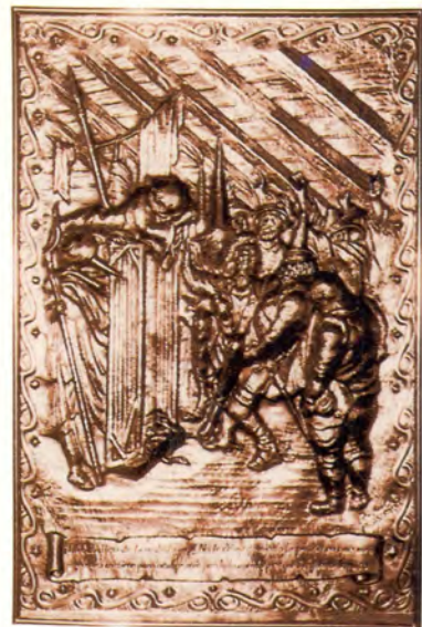
Ref.- DC 10700 (2)