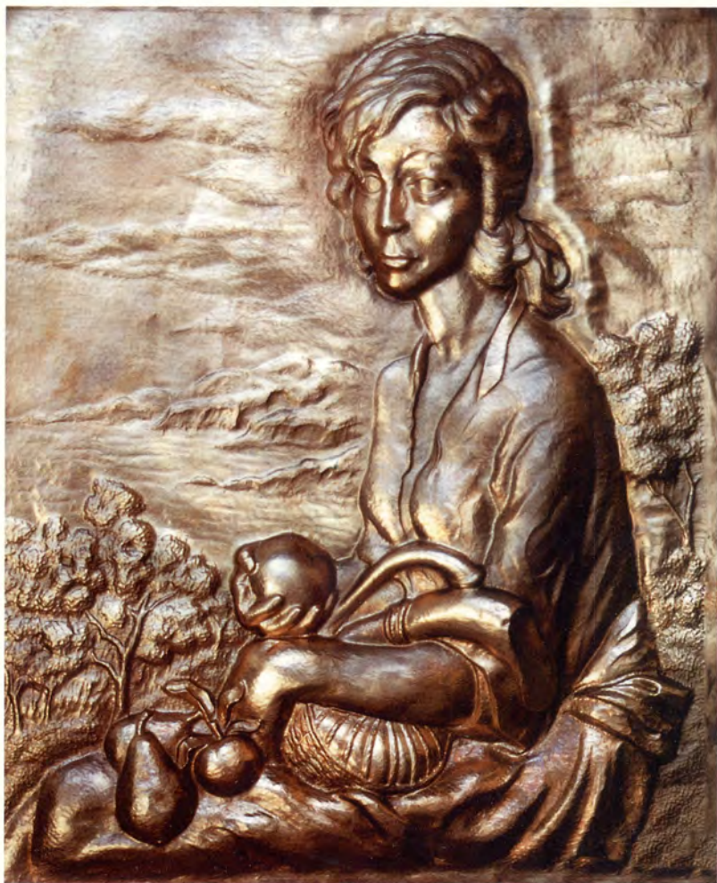
Ref.- DC 6000 Cuadro Niña Cobre Medidas 62 x 52 cm. 2000 grs.

ACABADOS: -Cobre Patinado. -Plateado Oxidado.