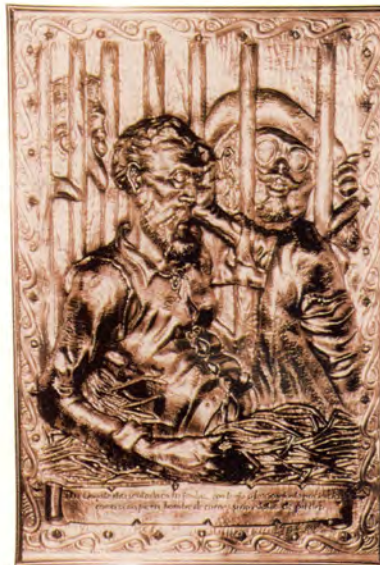
Ref.- DC 10700 (3)

Cuadro del Quijote Medidas 24 x 35 cm. 350 grs.