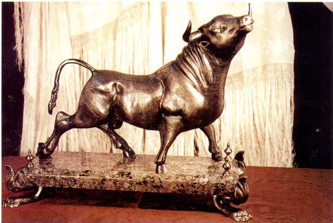
Ref.- DI 1080 Toro Medidas 50 x 28 x 35 cm. 6650 grs. (*) Opcional Peana.

ACABADOS: -Metal Brillo. -Bronce Viejo. -Plateado Oxidado.