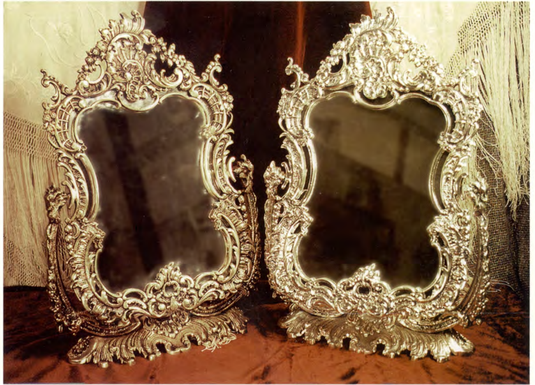
Ref.- DE 3000 Espejo Flores Porta Retrato Medidas 44 x 29 x 11 cm. 4300 grs.