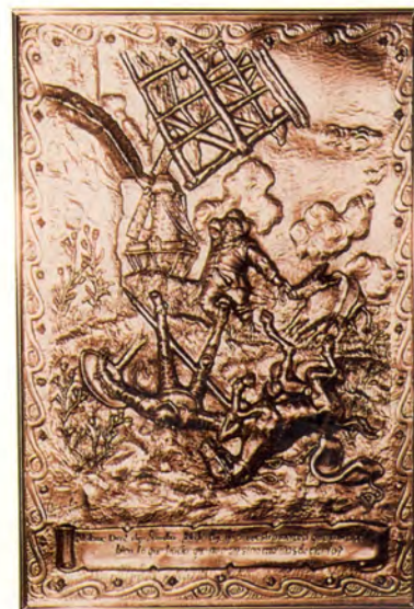
Ref.- DC 10700 (5)