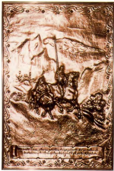
Ref.- DC 10700 (1)