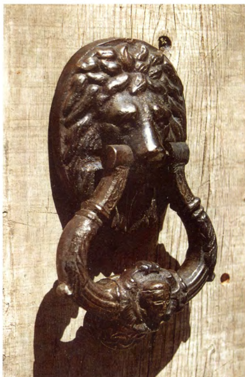
Ref.- DA 7080 León Mediano Medidas 21 x 14 cm. 2400 grs.