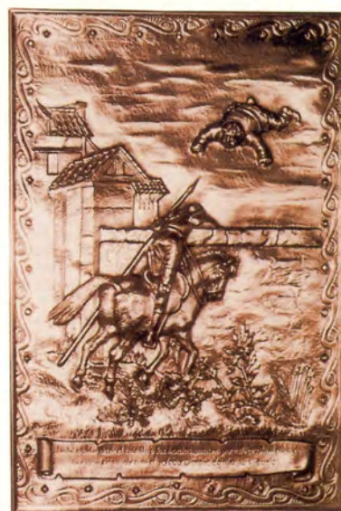
Ref.- DC 10700 (7)

Cuadro del Quijote Medidas 24 x 35 cm. 350 grs.