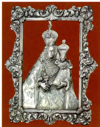
Ref.- DC 3000 (*) Cuadro Virgen de Araceli Medidas 24 x 19 cm., 950 grs.