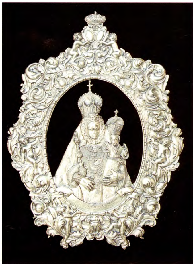
Ref.- DC 1000 Cuadro Virgen de Araceli Medidas 64 x 48 cm., 1100 grs.