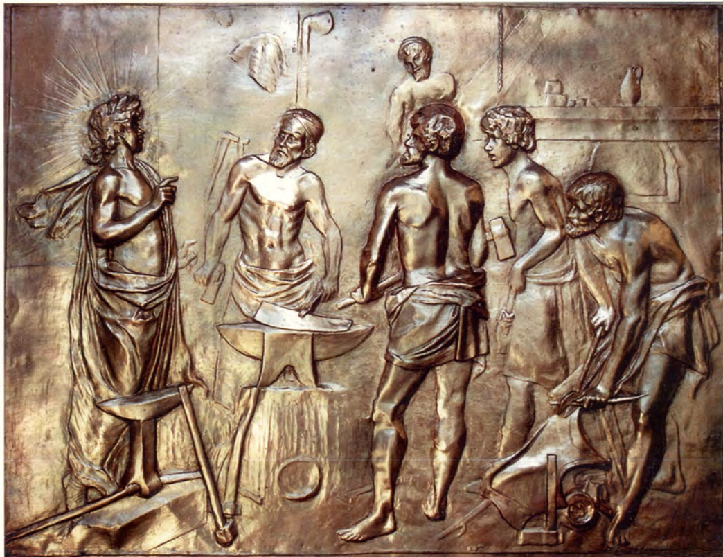
Ref.- DC 5000 Cuadro La Fragua de Vulcano Velazquez Medidas 75 x 57 cm. 2050 grs.

ACABADOS: -Cobre Patinado. -Plateado Oxidado.