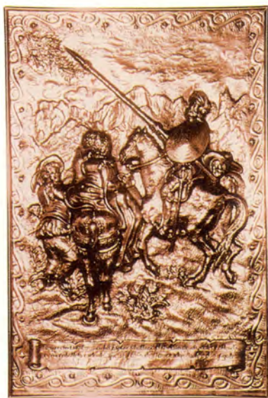
Ref.- DC 10700 (4)

ACABADOS: -Cobre Patinado. -Plateado Oxidado.