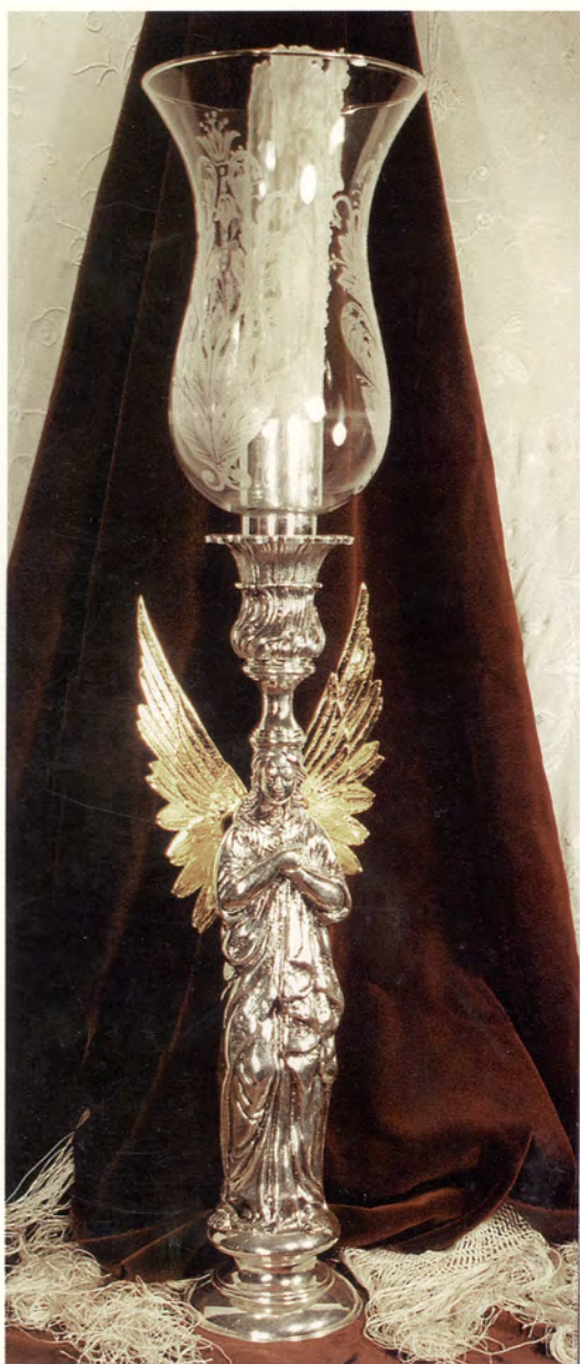
Ref.- DI 2009 Luz de San Rafael Tulipa de Cristal Soplado Medidas 50 x 18 x 8 cm. 3700 grs.