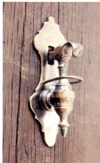
Ref.- DA 2080 Aldabón Puente Chico Medidas 17 x 7 cm. 500 grs.