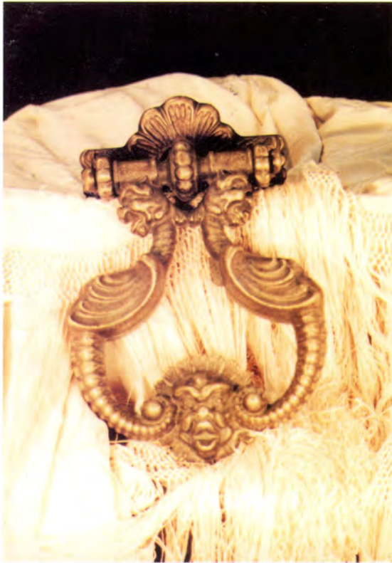
Ref.- DA 11000 Aldabón Dragones Medidas 23 x 8 cm. 4200 grs.