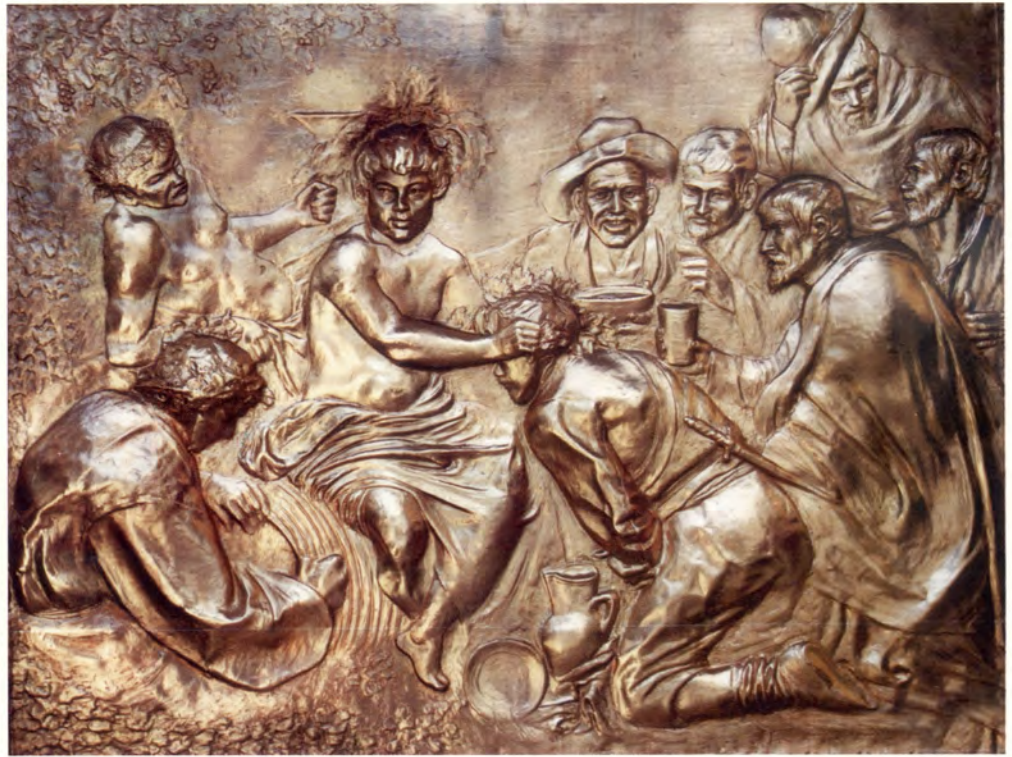
Ref.- DC 4000 Cuadro Los Borrachos Velazquez Medidas 74 x 58 cm. 2450 grs.

ACABADOS: -Cobre Patinado. -Plateado Oxidado.