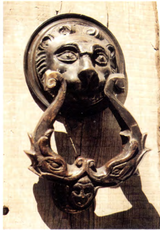
Ref.- DA 12080 Aldabón León Grande Medidas 26 x 16 cm. 3200 grs.